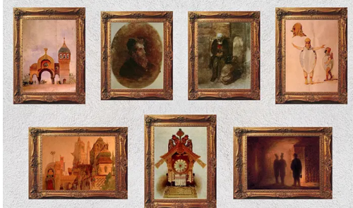
Sélection de tableaux d'une exposition de Viktor HARTMANN (1834-1873) présentés à l'Académie des Beaux-arts de Saint-Petersbourg en 1874

♪ Sergueï RACHMANINOV (1873-1943) Études-tableaux , Op. 39, n° 3, 1916-1917, durée : 2'46''