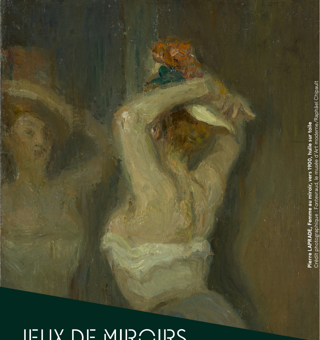
Pierre LAPRADE, Femme au miroir, vers 1900, huile sur toile