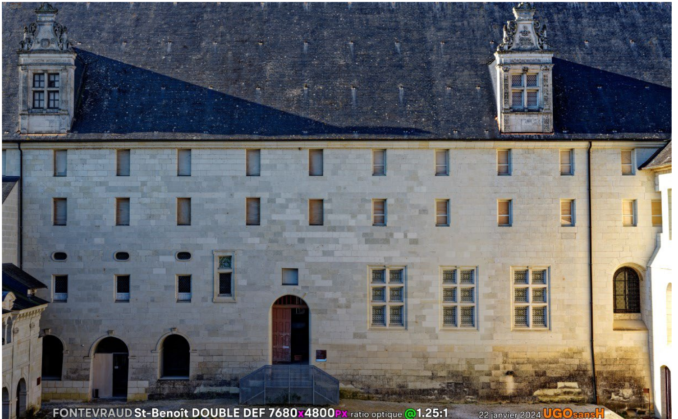
FONTEVRAUD St-Benoît DOUBLE DEF 7680x4800px ratio optique @1.25:1